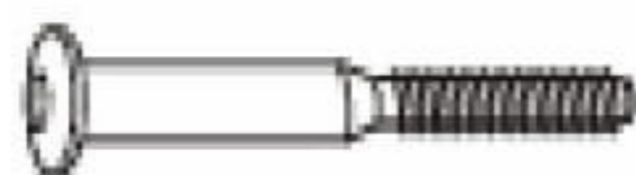
Skrutka M6 - 8 ks M6-os csavar – 8 db