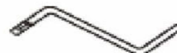
Imbusový kľúč - 1 ks Imbuskulcs – 1 db